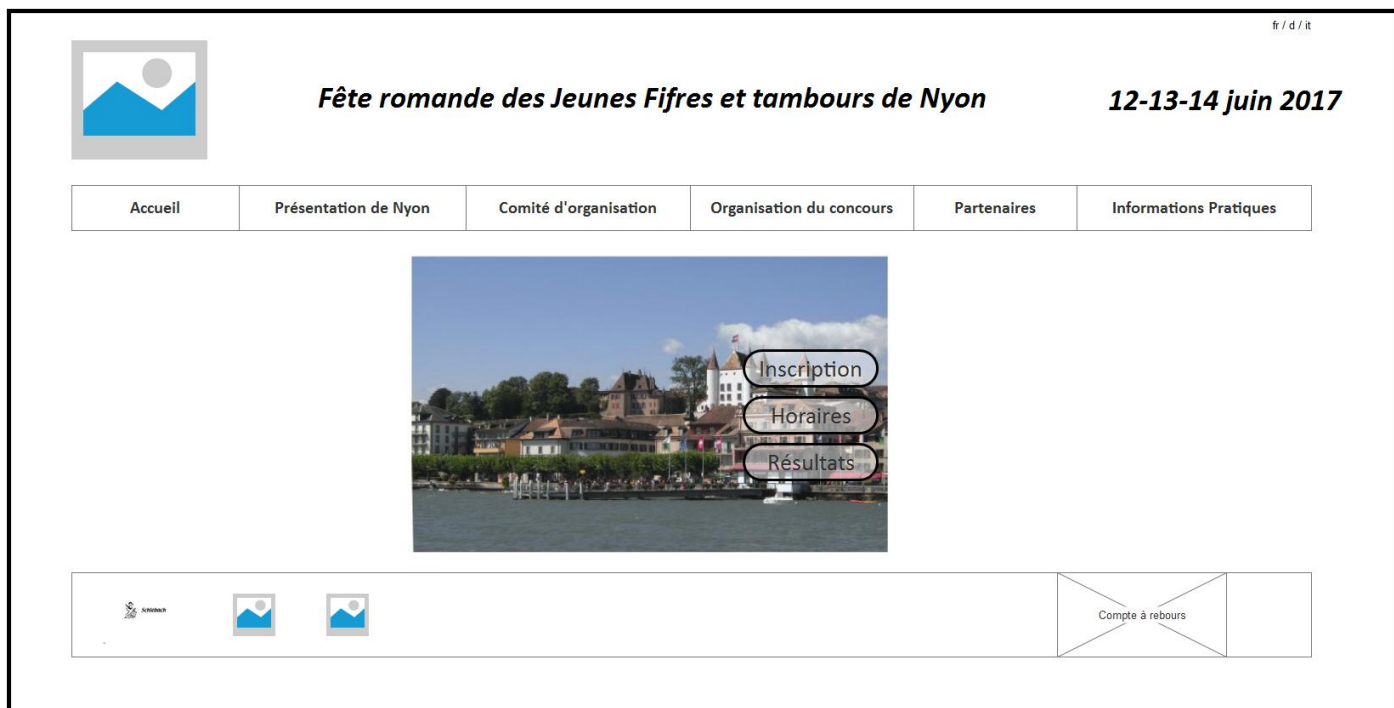
Figure 2 : Maquette de la Page d'accueil